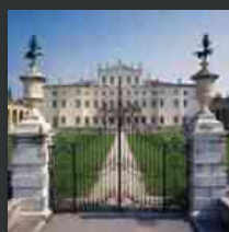
Villa Manin, la mostra sui