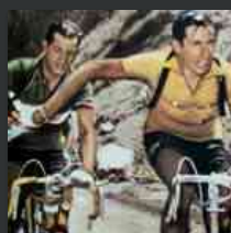
A Udine la mostra fotografica “Scatti: