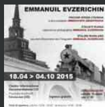
Torviscosa, una mostra fotografica