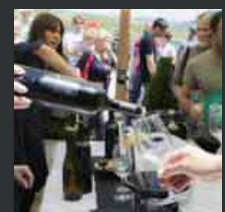
Torna Cantine Aperte, 37 le