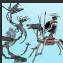
Tra mostri e cavalieri,