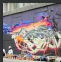
X edizione di “Elementi