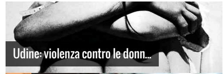
Udine: violenza contro le donn...