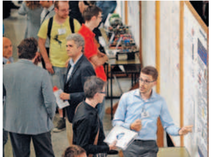
UDINE. Due immagini dell'affollato evento che si è svolto ieri al Campus universitario dei Rizzi