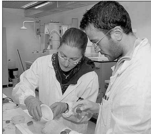
Ricercatori al lavoro in un laboratorio al parco scientifico "Luigi Danieli"