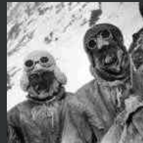
k2, 60 anni dopo: a Udine una mostra per celebrare la storica impresa