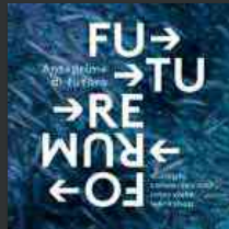
Future Forum, da Udine a Napoli la rassegna su futuro e innovazione