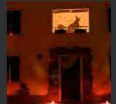
La 'Vilie dai Sants' a Chiopris