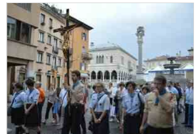
Corpus Domini 2014 22 giu | 21:47