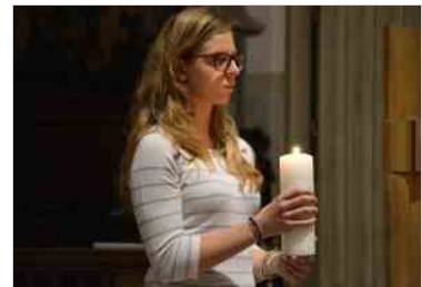
Veglia di Pentecoste dei giovani con l'Arcivescovo