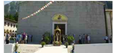
Gemona, S. Messa per il patrono, Sant'Antonio - 13 giugno 2014

Entrando nel merito della nuova applicazione, la schermata iniziale presenta le attività divise per categorie (si va dall'abbigliamento, alle farmacie), nonché i servizi di utilità e le informazioni turistiche. Presenti ovviamente anche i profili delle istituzioni culturali della città, quindi i musei, il Monastero/Tempietto Longobardo, i percorsi turistici. «Si è voluto sviluppare un software - continua Pesante - dedicato alla città e ai commercianti, ma in particolare, ai nostri ospiti che, sempre più numerosi e "tecnologici", vengono a trovarci e rapidamente vogliono conoscere l'offerta territoriale che in quel momento viene loro proposta. Un lavoro minuzioso, aperto a modifiche ed integrazioni che ogni singolo aderente alla convenzione, in autonomia, ma con la supervisione dei funzionari incaricati, potrà costantemente effettuare: promozioni, saldi, mostre, presentazioni e quant'altro a portata di indice o di un "click" a seconda dello strumento utilizzato». La nuova app, infatti, potrà essere visualizzata ed utilizzata dai più avanzati strumenti quali tablet, smartphone, pc, netbook, notebook, ecc. e l'utente potrà «votare» ciò che più gli piace dando subito un feedback, di quanto pubblicato.