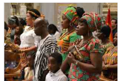
Festa diocesana degli immigrati cattolici