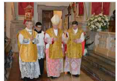
Guarda le foto del 250° del Duomo di Tolmezzo 25 giu | 07:52