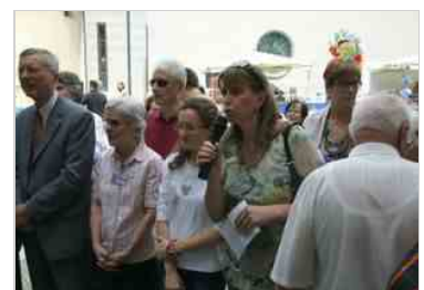
Inaugurazione dell'Emporio amico "Di man in man" a Gemona - 13 giugno 2014 13 giu | 16:26