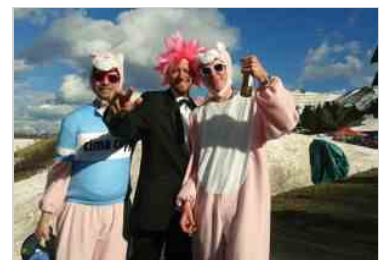
Il Giro d'Italia in Friuli