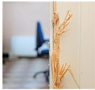
Nella foto a sinistra la polizia scientifica al lavoro; al centro la macchinetta cambia-soldi forzata; l'ingresso del Polo umanistico. A destra gli uffici con gli armadi aperti dai ladri e, sotto, il personale davanti all'ingresso