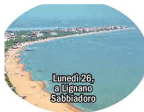
Lunedì 26, a Lignano Sabbiadoro