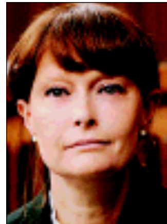
L'assessore Fvg Alessia Rosolen ha aggiunto nuovi fondi per le università, da utilizzare per sviluppare ricerca e servizi inter-ateneo

Per la giunta aver aumentato i fondi un banco di prova. Significa voler investire nell'istruzione e credere nelle potenzialità delle nostre istituzioni per la formazione