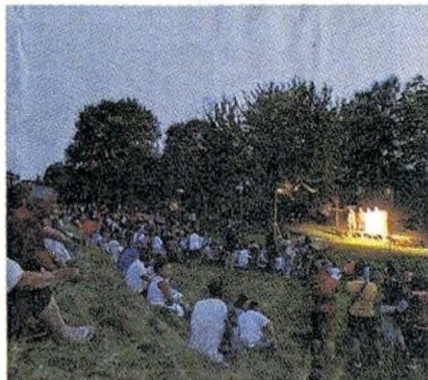
Un momento dello spettacolo nel parco dell'Isonzo (Aizza)

A giocare un ruolo importante nel gradimento del pubblico anche il fatto che lo spettacolo proposto sia stato senza dubbio di qualità: oltre al testo del grande Bardo, anche la messa in scena dei ragazzi della compagnia, fatta con rigore e passione. Insomma, un esordio alla grande per il teatro sul fiume, e senza dubbio un'iniziativa da replicare. L'appuntamento, inutile dirlo, è per il 21 giugno del prossimo anno.