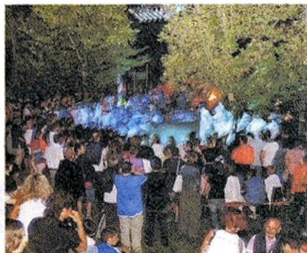
Grande partecipazione alla manifestazione di Turriaco (Aizza)

IL PICCOLO - Provincia Gorizia 23/06/2011