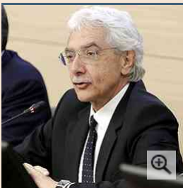
Il direttore generale di Bankitalia Salvatore Rossi

«Il primo trimestre del 2015 dovrebbe far segnare un piccolo aumento del Pil e si tratterebbe del primo di una serie di rialzi trimestrali che proseguirebbero fino a tutto il 2016». Ad affermarlo è stato il direttore generale di Bankitalia Salvatore Rossi, intervenuto all'Università di Udine, che ha ricordato come «l'imperativo categorico per l'oggi è uscire dalla recessione. Questo è possibile».