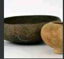
Adriatico senza confini, mostra al Castello di Udine