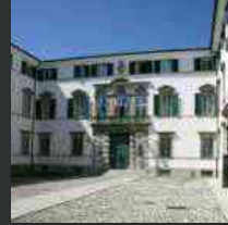
La mostra di Gaetano Bodanza al salone del Tiepolo