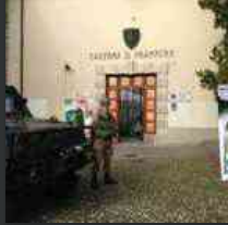
Mostra alla Di Prampero: La Croce Rossa Italiana, da Solferino alla Grande Guerra