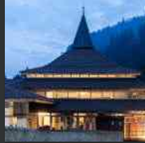
Ad Arta Terme la mostra dedicata a Gino Valle