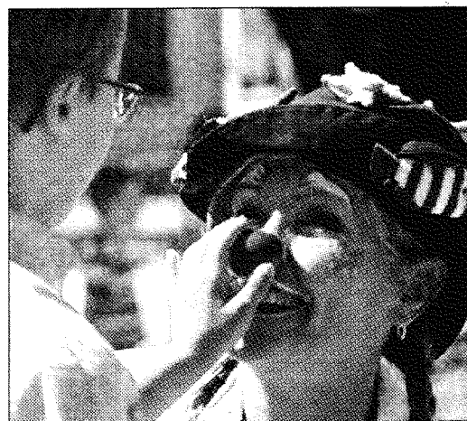
DOTTOR CLOWN In ospedale un sorriso per i bambini

UNIVERSITÀ. Nella graduatoria nazionale degli enti di ricerca e degli