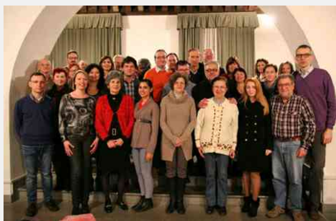
Lingua Friulana a Uniud

Università degli Studi di Udine – Lingua Friulana: conclusi i corsi autunnali per dipendenti delle pubbliche amministrazioni