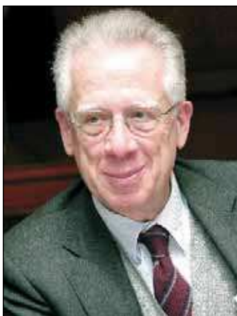
Tommaso Padoa Schioppa