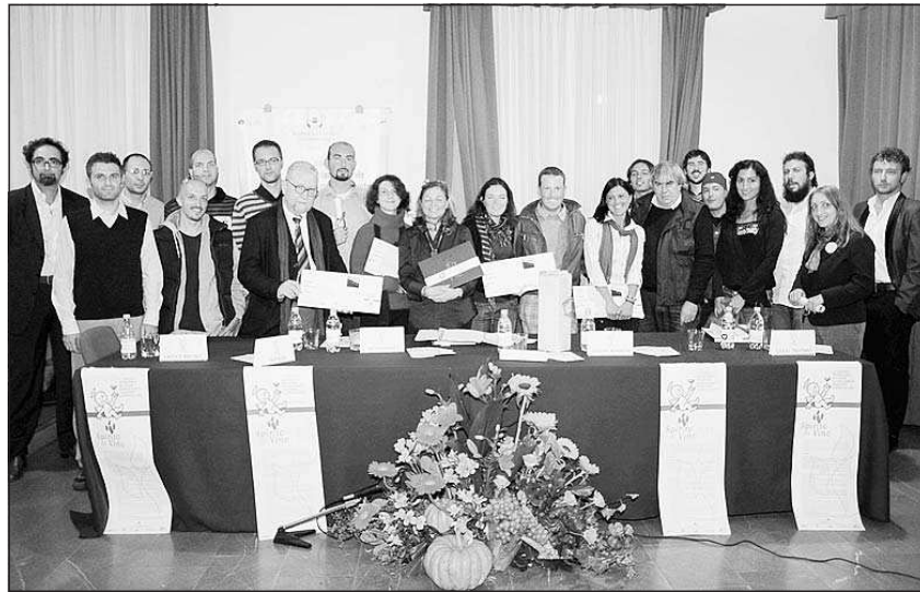
Foto di gruppo alla cerimonia di premiazione del concorso "Spirito di Vino", organizzato dal Movimento Turismo del Vino Fvg