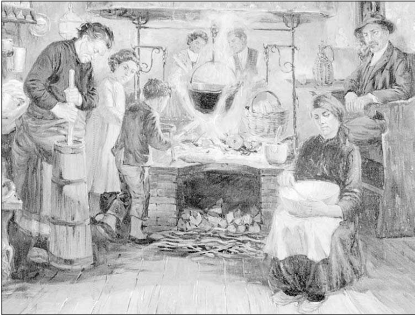
Una raffigurazione del tipico fogolar friulano espressione di una cucina povera, ma originale; a destra la copertina del libro edito da Forum