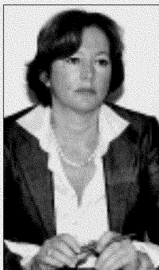
Il rettore Cristiana Compagno

UDINE. Università di Udine di nuovo al top con le facoltà di Lingue e di Medicina al primo posto in Italia. Un bel risultato visto che Lingue ha saputo recuperare quella manciata di punti che lo scorso anno la fece scendere al secondo posto, mentre Medicina continua a difendere il primato da ben otto anni. A consegnare il premio qualità all'ateneo friulano è il rapporto annuale targato Repubblica e Censis che valuta la produttività, la didattica, la ricerca e i rapporti interna-