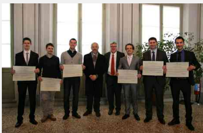
Premi di Laurea Danieli Uniud

Università degli Studi di Udine – Assegnati i Premi di Laurea Danieli da 4000 mila euro a sei neo laureati magistrali in ingegneria