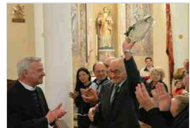
Benedizione del restauro della chiesa di Zompitta