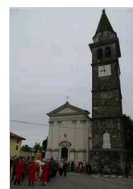
Riapertura del Santuario di Muris di Percoto dopo il restauro, domenica 3 maggio 2015