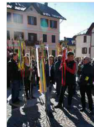
20ª Rogazione della Pieve di Gorto da Forni Avoltri a Frassenetto, domenica 19 aprile 2015