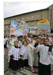
Chierichetti in festa