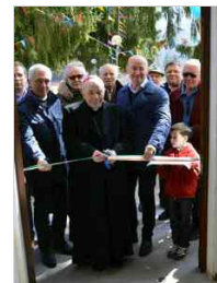
Benedizione della casa per ferie della parrocchia di Lignano a Fusine