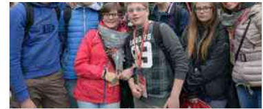
Il pellegrinaggio dei giovani friulani alla Sindone e sui luoghi di don Bosco

Come ricordato, UdineVicina è un'applicazione aperta a nuove collaborazioni, così da offrire sempre più servizi utili a cittadini e turisti. Per informazioni, proposte, richieste o suggerimenti è possibile inviare una email all'indirizzo app@comune.udine.it .