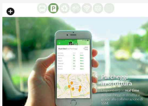
La sezione parcheggi della nuova app UdineVicina

15.05.2015 Tantissimi servizi e informazioni utili, dagli orari degli autobus agli avvisi sul traffico, dagli eventi in programma alle notizie, dai luoghi da visitare con mappe geolocalizzate, ai parcheggi disponibili e molto altro ancora. Il tutto a portata di mano con un semplice "click". È stata lanciata ufficialmente oggi, venerdì 15 maggio, "UdineVicina", la nuova applicazione per smartphone e tablet