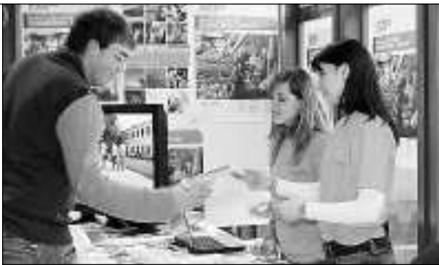
Due immagini del salone dello studente, che si chiuderà oggi