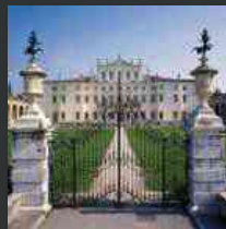
Villa Manin, la mostra sui capolavori dell'Avanguardia russa