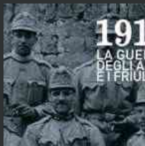
Mostra multimediale ad Aquileia: "1914 - la guerra degli altri e i friulani"