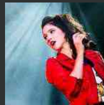
Lodovica Comello, la star di 'Violetta' a Udine