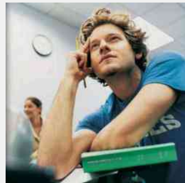
News test professioni sanitarie 2015

In linea generale, tuttavia, l'iscrizione contempla in tutti i casi la compilazione di un modulo online e il successivo pagamento della tassa di partecipazione.