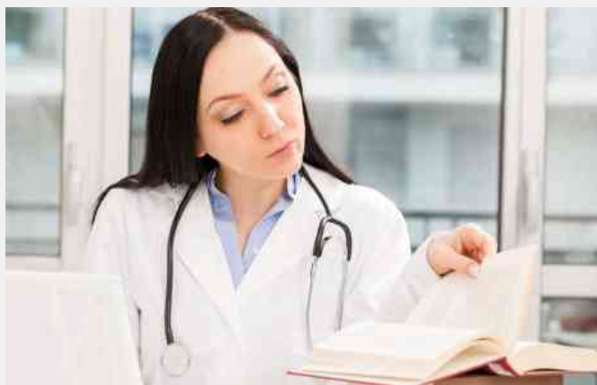
Professioni Sanitarie 2015

News Professioni Sanitarie 2015. Tutto quello che devi sapere sulle modalità di iscrizione al Test Professioni Sanitarie 2015, i programmi da studiare, date, preferenze, composizione delle graduatorie, scorrimenti