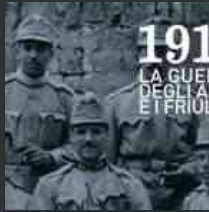
Mostra multimediale ad Aquileia: "1914 - la guerra degli altri e i friulani"