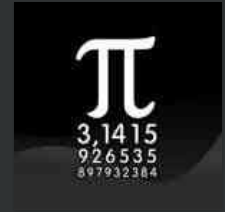
Udine, ritorna la festa del Pi Greco: la matematica sale in cattedra