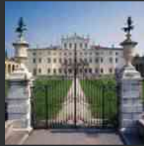
Villa Manin, la mostra sui capolavori dell'Avanguardia russa