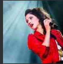
Lodovica Comello, la star di 'Violetta' a Udine