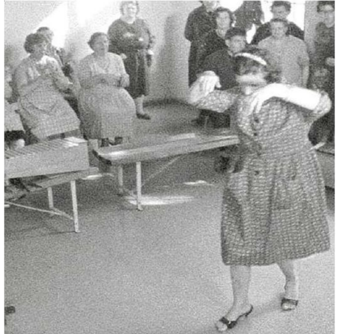
Due "fermo-immagine" tratte dal documentario "Eccoli", collage di video clinici degli anni di Basaglia a Gorizia