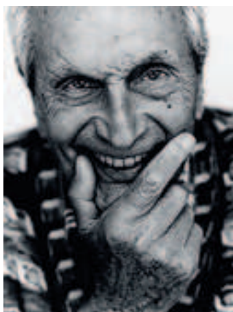
LO STILISTA. Ottavio Missoni

ATTIVITÀ DEGLI STUDIOSI Il tema al centro del Laboratorio sarà affrontato nel lavoro quotidiano dei 99 studiosi giunti a Gemona da tutto il mondo, attraverso diversi ambiti: lingua, lettere, arti, socio-politica e ambiente mentre, la sezione Laboratorio, prevede momenti integrati: aggiornamento linguistico e culturale, creatività nelle botteghe di archeologia, giornalismo, radio, musica, teatro, video-televisione, movimento-improvvisazione e street-art, convegni internazionali di studio, ricerche individuali in emeroteca, biblioteca, videoteca e nella Cineteca del Friuli di Gemona. Ricordiamo che il Lab si fonda sulla collaborazione scientifica tra l'Università Cattolica di Milano e l'Università di Udine ed è sostenuto dalla Regione Friuli Venezia Giulia, Comune di Gemona del Friuli, Provincia di Udine e Fondazione Crup.