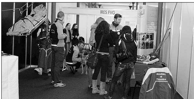
Visitatori allo stand del Soccorso alpino della Guardia di finanza allestito a Udine Fiere