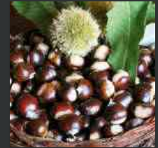
Valle di Soffumbergo: la 34a 'Festa delle castagne e del miele'