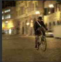
Le foto di Agostino Mansutti a Udine