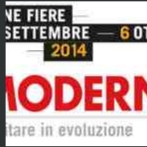
Casa Moderna: la 61a edizione della fiera