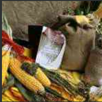
Farine e delizie della Carnia a Sutrio