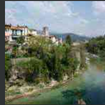
"Ponti, Epoche, Budapest", esposizione a Cividale del Friuli