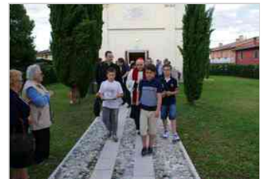
Inaugurazione della «Cjase da la Curtine» a Zompicchia di Codroipo - 30 giugno 2014