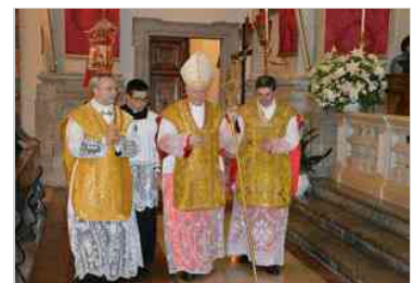
Guarda le foto del 250° del Duomo di Tolmezzo