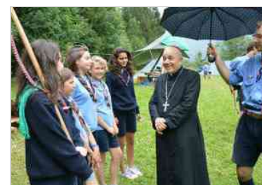
L'Arcivescovo al campo scout