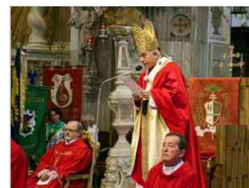
Santa Messa solenne per i santi Patroni, Ermacora e Fortunato - Udine, 12 luglio 2014