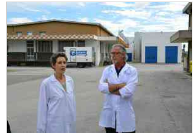
Latterie Friulane apre le porte dopo lo scandalo aflatossine