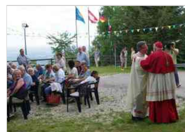
Festa della pace a Useunt di Tarcento con la celebrazione della Santa Messa da parte dell'Arcivescovo di Udine, mons. Mazzocato, domenica 3 agosto.