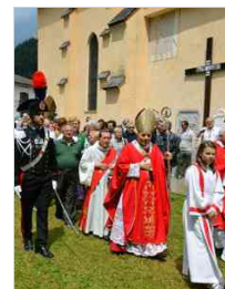
Ss. Pietro e Paolo a Tarvisio