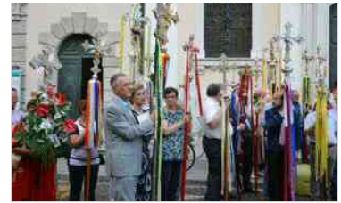
Primi Vespri della solennità dei S. Patroni Ermacora e Fortunato