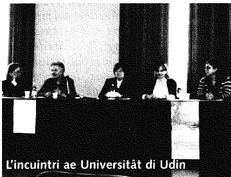
L'incuintri ae Università di Udin

Meti in vore une politiche linguistiche organiche nol è dal sigûr facil, si cjatin une vore di intops, sedi a nivel locâl che statâl. Po dopo il fat che la Cort costituzionâl no si sei ancjemò esprime in riferiment ai ponts impugnâts de leç regionâl 29 dal 2007 dal sigûr nol jude, anzit al pâr vè fermât dut intune sorte di limbo. L'impegno e la buine volontât dai operadôrs di setôr dal sigûr no mancin, la sperance e je che si rivedi in curt a un lôr ricognossiment uficiâl di bande des istituzions.