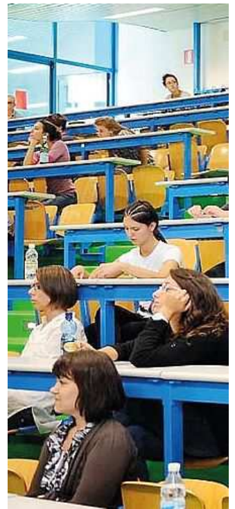
Candidati al test di medicina