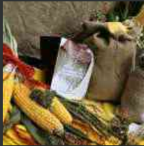
Farine e delizie della Carnia a Sutrio