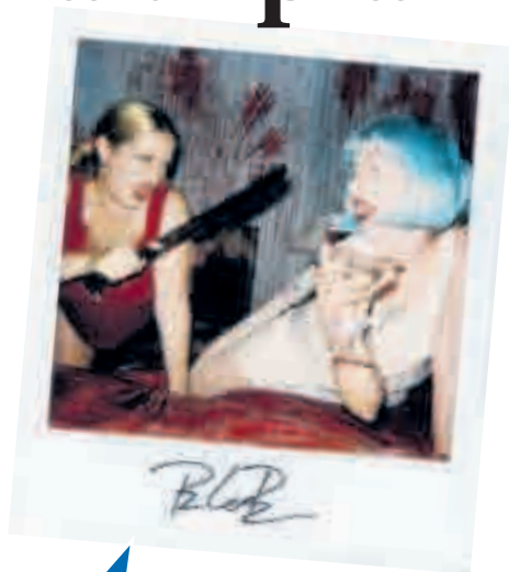
Una polaroid di Bruce LaBruce. In basso, immagini da film di Ben Russell e Dominic Gagnon

'Il cinema si impara? Sapere, formazione, professioni' è il tema portante di una rassegna organizzata dall'Università degli Studi di Udine, diretta da Leonardo Quaresima col coordinamento artistico di Sergio Fant , che partirà a Udine con il 19° Convegno internazionale di studi sul cinema , dedicato alla 'trasmissione dei saperi cinematografici', con oltre un centinaio di studiosi ed esperti da tutto il mondo. Per l'occasione, FilmForum ha promosso un monitoraggio sulle realtà pubbliche e private che insegnano i 'mestieri' del cinema, realizzando il primo database sulla formazione cinematografica in Ita-