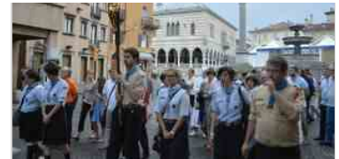
Corpus Domini 2014 22 giu | 21:47

La ricerca coinvolge, per la parte italiana le università di Udine, Trieste, Ferrara, Padova e il Comune di Ferrara; per parte slovena l'Università del Litorale di Capodistria, l'Istituto sloveno di salute pubblica, i Comuni di Capodistria e Kranj e l'Ospedale generale di Isola. «Pangea» è finanziato, nell'ambito del Programma per la cooperazione transfrontaliera Italia-Slovenia 2007-2013, dal Fondo europeo di sviluppo regionale e dai fondi nazionali.