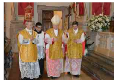
Guarda le foto del 250° del Duomo di Tolmezzo