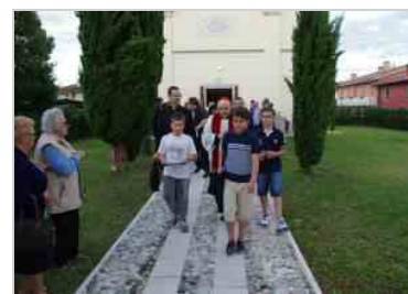
Inaugurazione della «Cjase da la Curtine» a Zompicchia di Codroipo - 30 giugno 2014