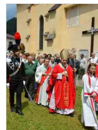
Ss. Pietro e Paolo a Tarvisio 29 giu | 18:04