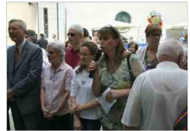
Inaugurazione dell'Emporio amico "Di man in man" a Gemona - 13 giugno 2014 13 giu | 16:26