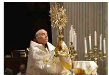
Veglia di Pentecoste con le associazioni laicali 7 giu | 23:13