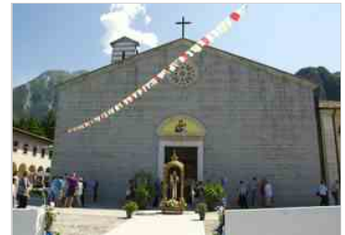
Gemona, S. Messa per il patrono, Sant'Antonio - 13 giugno 2014 13 giu | 16:17