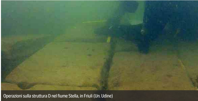
Operazioni sulla struttura D nel fiume Stella, in Friuli (Un. Udine)

Lo Stella è un fiume che nasce in una risorgiva a sud di Codroipo e sfocia nella laguna di Marano, mettendo in contatto l'alta e media pianura friulana con il mare. In epoca antica rappresentava un'importante via di comunicazione, ricca di traffici e di commerci, perché navigabile tutto l'anno: lo testimoniano i numerosi resti archeologici, datati a partire già dall'età del bronzo, individuati nelle sue acque. Proprio per ricostruirne il passato e proseguire con il recupero di reperti è appena partita una nuova campagna di archeologia subacquea.