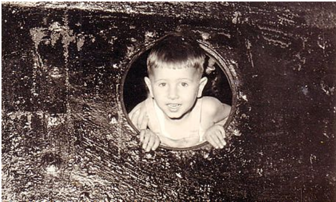
Un'immagine dalla mostra “In viaggio”, da oggi a Lignano Sabbiadoro