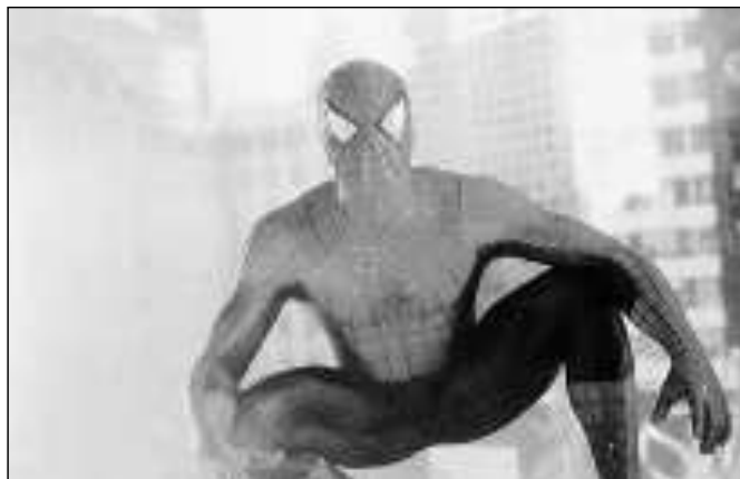
Due recenti film diversamente connessi con il mondo e con l'arte del fumetto: "300" e Spider Man"

Ultracentenari, praticamente coetanei, separati da una manciata di settimane nella data che sigla la loro nascita ufficiale, racchiusa fra la prima proiezione dei fratelli Lumière, nel dicembre 1895, e la pubblicazione di The Yellow Kid sul New York World , nel febbraio 1896: cinema e fumetto sono arti da sempre accostate, messe a confronto, accomunate per una sorta di affinità elettiva. Certamente per quella originale cifra espressiva che ne rappresenta il peculiare trait d'union , e che si traduce nel racconto di storie e personaggi attraverso una sequenza di immagini. Non è un caso che, da oltre un secolo, fra cinema e fumetto esistano significativi rapporti, influenze e trasposizioni reciproche: e proprio alle molteplici contiguità fra questi due media – da una definizione comparata alle suggestive ipotesi di evoluzione e interazione futura – è dedicata l'edizione 2008 del convegno di studi sul cinema promosso come sempre dall'Università di Udine per la direzione artistica del docente di storia e critica del cinema Leonardo Quaresima. Novità rilevante di quest'anno è che l'aspetto di approfondimento e confronto convegnistico si inserirà in una rassegna, di scena fra Udine e Gradisca, con un ricco programma di proiezioni, percorsi espositivi, pubblicazioni di settore e premi intorno alla scrittura cinematografica.