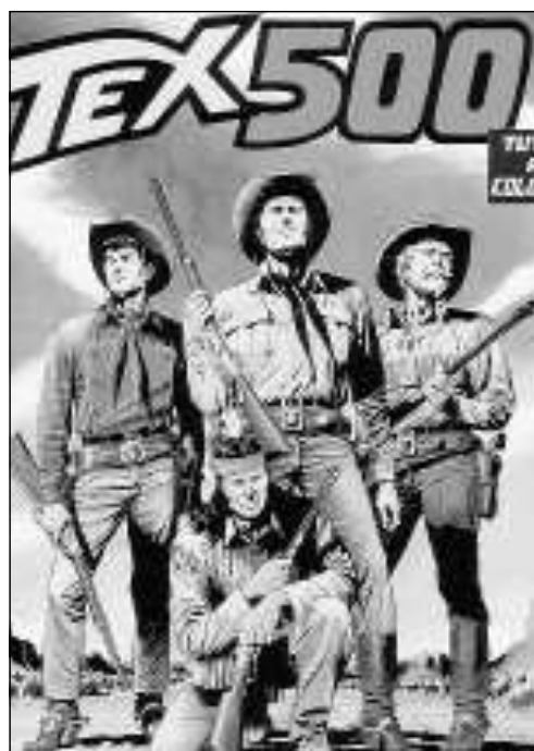
Il manifesto del film "Little Nemo" e il celebre fumetto "Tex Willer"