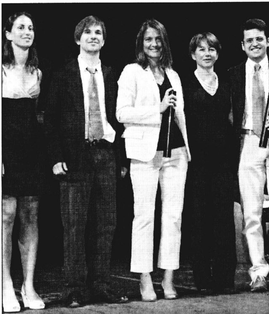
Foto di gruppo al Teatro Nuovo per le premiazioni di Start Cup