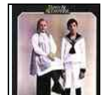
Fanny e Alexander