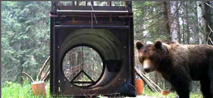
Orso filmato in Alpi carniche, mangia esca ma sfugge cattura

◀ Indietro | 🖨️ Stampa | ✉️ Invia | ✉️ Scrivi alla redazione | 💬 Suggestisci ()